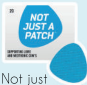
Not just a patch